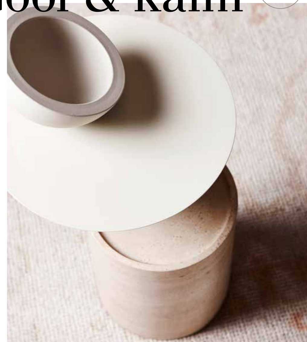
Bijzettafel De La Espada van Neri&Hu.

Dit huis staat in Melbourne maar voelt heel Europees aan. Het geheim? Een verzameling antieke Franse deuren en ramen die op een heel frisse en hedendaagse manier zijn toegepast.